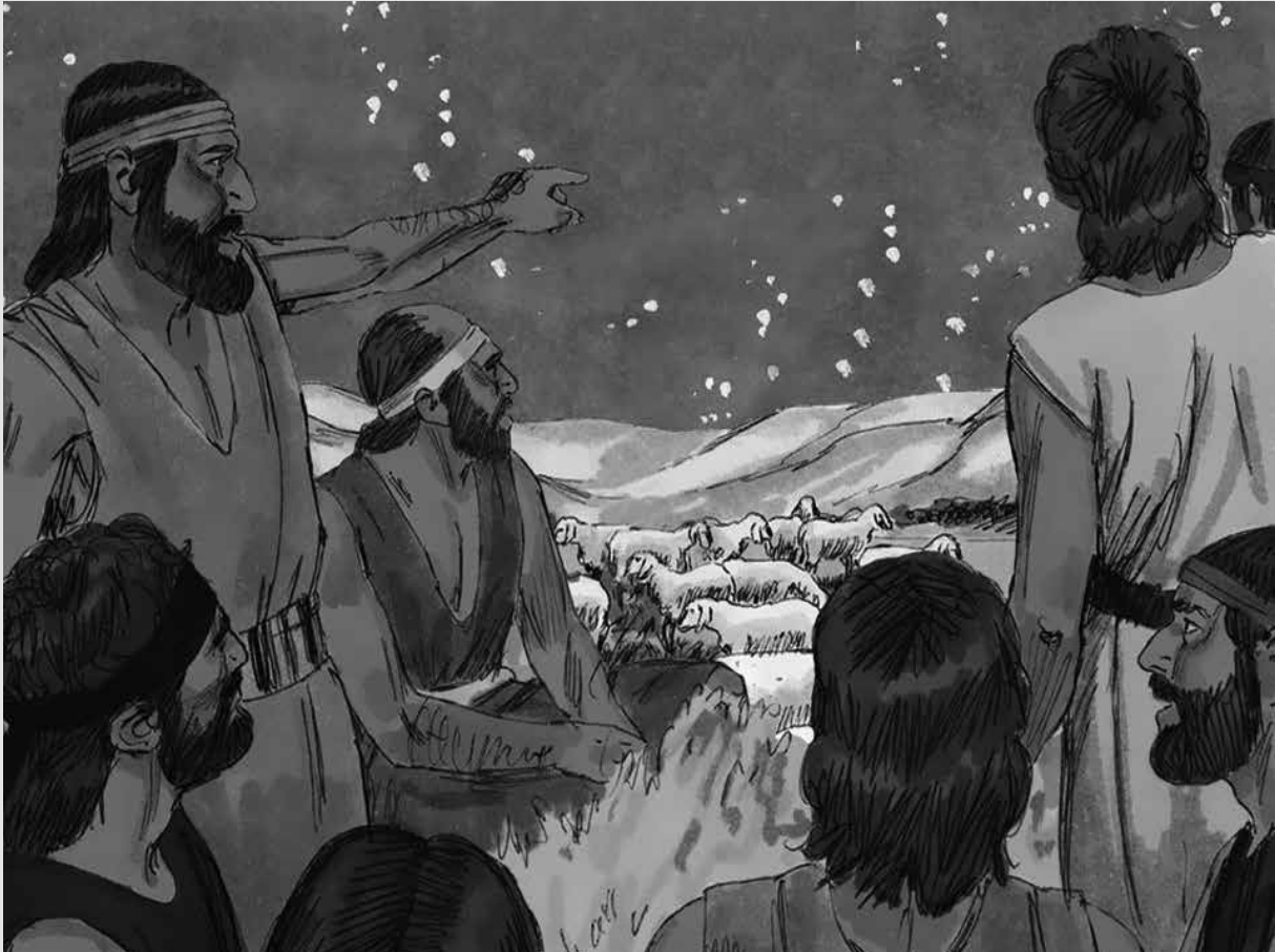
De herders in het veld